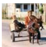
Osel s vozíkem v Ázerbájdžánu, nedaleko ropovodu Baku-Ceyhan.