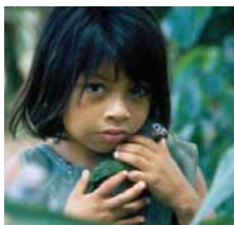
Domorodé děvčátko z Timpie z jedné z komunit ohrožených plynovodem v Peru.

Sedmdesát procent chudých obyvatel světa jsou ženy, přesto však neexistuje žádný zvláštní předpis, jenž by jim zajistil přínosy z projektů v těžebním průmyslu – tedy v oblasti těžby ropy, zemního plynu a báňského průmyslu.