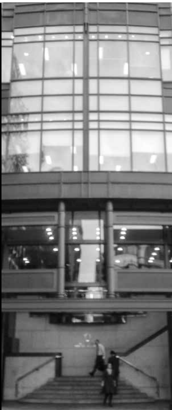
Штаб-квартира ЕБРР в Лондоне

Процедуры Всемирного банка не предусматривают безоговорочного участия общественности на раннем этапе при определении объема оценки – именно в тот момент, когда принимаются ключевые решения. Тем не менее, Банк призывает заемщиков проводить консультации с «затрагиваемыми группами» и неправительственными организациями через короткий промежуток времени после определения категорий ОВОС (отбор). В случае проектов категории «А» сотрудникам Банка рекомендуется принимать