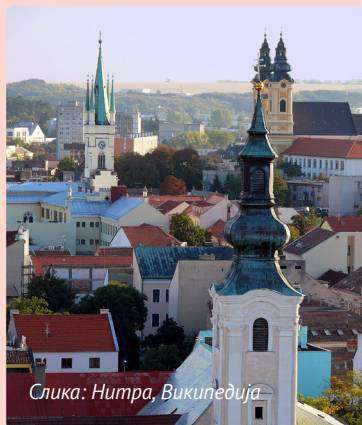
Слика: Нитра

Сега сме подготвени да преземеме позитивна акција.