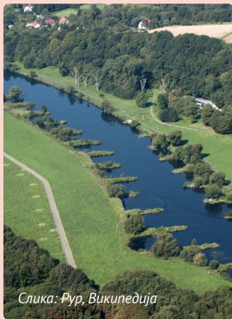
Слика: Рур, Википедија

За среќа, процесот на праведна транзиција е веќе во тек во многу делови од Европа и светот. Голем е бројот на успешни приказни од повеќе земји, секоја со свој контекст, приоритети, визији, акциски планови и резултати.