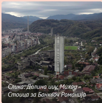
Слика: Долина иу

Во регионот Рур во Германија, процесот на деиндустријализација започна во педесеттите години од минатиот век поради зголемувањето на цената на јагленот. Една деценија подоцна, локалната самоуправа имаше соработка со рударски синдикати, банки, стопански комори и со малите и средни претпријатија за да подготви една серија од интервенции неопходни за реструктурирање и преквалификација на работната сила, промовирање на технолошки иновации и повторно обмислување на подрачјата наменети за домување. Како резултат на ова, регионот успеа да развие нови сектори на економска активности кои првенствено беа ориентирани кон информациската технологија, биомедицина или технологии за заштита на животната средина. Во овој контекст, регионот ја има развиено најгустата мрежа на академски институции во Германија која опфаќа пет универзитети и осум технички училишта, и истовремено е домаќин на преку 600 бизниси.