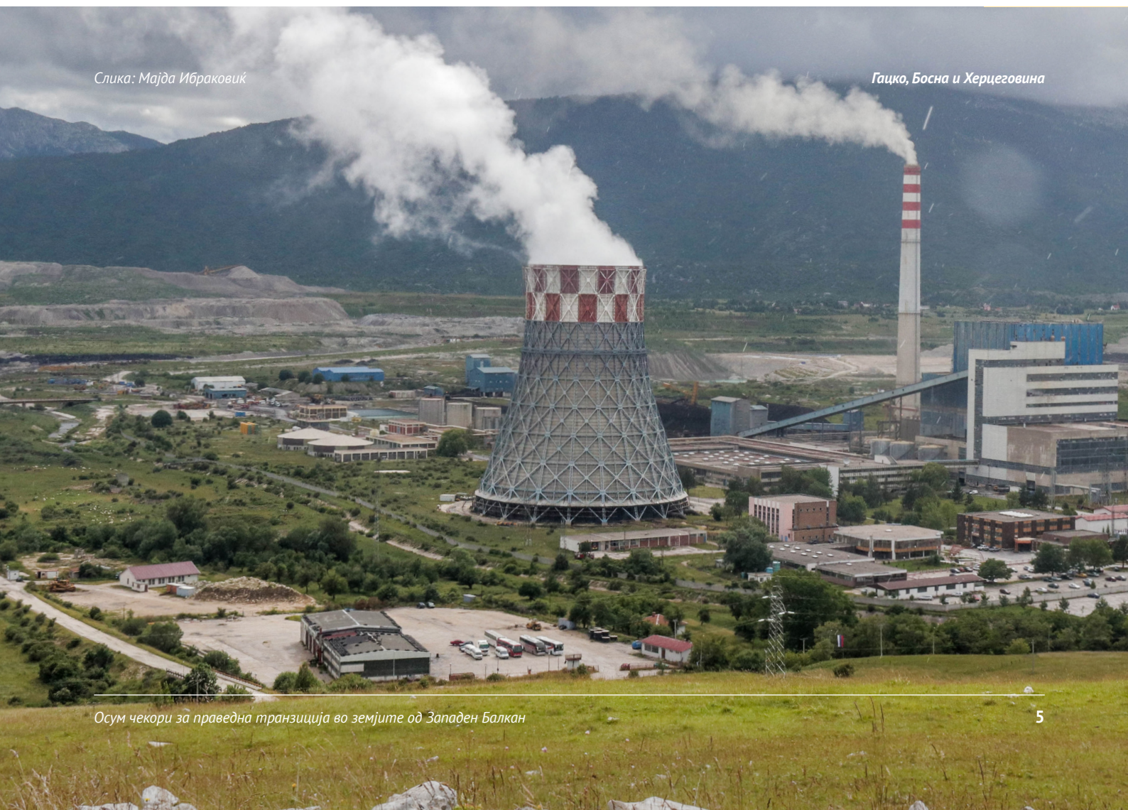
Гацко, Босна и Херцеговина