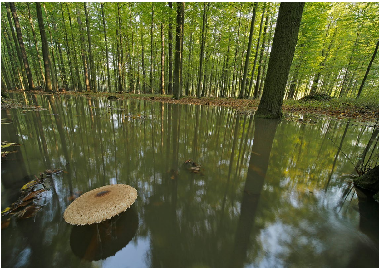
■ Przykład zakończonej sukcesem renaturyzacji koryta Odry

W czasie między ukazaniem się oryginalnego raportu, a niniejszym tłumaczeniem, Komisja Europejska (KE) i Rada Unii Europejskiej zaakceptowały Krajowy Plan Odbudowy (KPO). Niemniej jednak pełna treść planu wciąż nie została upubliczniona. O zmianach wprowadzonych do Krajowego Planu Odbudowy w trakcie negocjacji możemy wnioskować z decyzji wykonawczej Rady Unii Europejskiej 30 i aneksu 31 do niej. Wypłata pieniędzy w ramach KPO uzależniona jest od realizacji tak zwanych kamieni milowych. Dotyczą one wielu reform i inwestycji zawartych w Planie, co – przynajmniej na papierze – poprawia jego wiarygodność i daje więcej nadziei na to, że pieniądze z KPO zostaną wydane faktycznie na „zieloną odbudowę”, a nie wątpliwe z punktu widzenia katastrofy klimatycznej inwestycje.