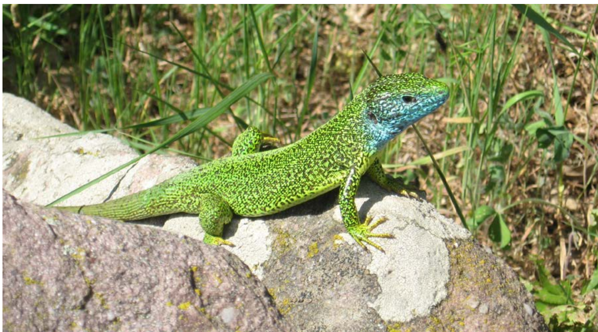
■ Zelembać u parku prirode Vrachanski Balkan, Natura 2000 području u Bugarskoj.

Na sva četiri okrugla stola sudionici – zainteresirane strane i donosioci odluka – su identificirali slične, ako ne i identične tipove uskih grla.