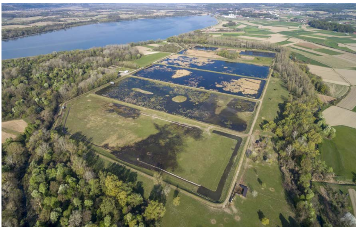
■ Prirodni rezervat Ormoške lagune, Slovenija: močvarno područje od 55 hektara od iznimnog nacionalnog i međunarodnog značaja za mnoge ugrožene vrste ptica.

Na primjer, u Bugarskoj i Latviji, premda postoje neki programi praćenja bioraznolikosti, rezultate provođenja poljoprivrednih mjera i njihovog utjecaja na bioraznolikost se ne proučava. Nedostatak praćenja i/ili analize rezultata okolišnih programa koje provode nacionalne vlasti također vodi nedostatku transparentnosti. Često nije jasno jesu li, i do koje mjere, projekti bili uspješni u postizanju svojih naznačenih ciljeva, a to je pak propuštena prilika za obrazovanje drugih dionika o važnosti takvih projekata.