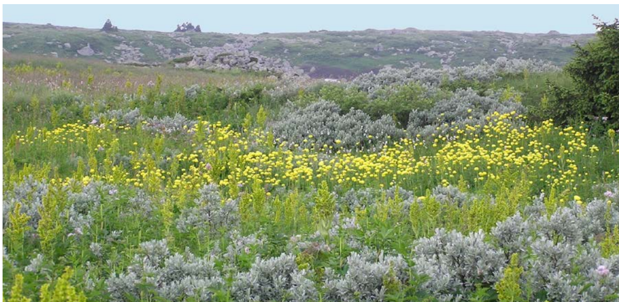
■ Park prirode Vitoša, Bugarska. Natura 2000 područje, subalpske zajednice vrba.

Bavljenje tim uskim grlima zahtijevat će ponovno promišljanje toga kako se osmišljavaju fondovi i mijenjanje ponašanja kroz učenje i uvećavanje znanja na svim razinama, kao preuvjeta za političku volju i inicijativu. Poteškoće leže u broju razina na kojima treba doći do takvih promjena, od nevladinih organizacija do najviših donositelja odluka na nacionalnoj i europskoj razini. Bez dostatne svijesti i razumijevanja predvodnika poput izabranih političara, do sistematskih promjena neće doći. U kontekstu uzastopnih ekonomskih šokova koje su izazvale pandemija, inflacija i ograničena dostupnost sirovina, racionalno ponovno promišljanje postojećih procesa financiranja bioraznolikosti vrlo je ambiciozno, no posve nužno. Preporuke koje slijede smjeraju unaprijediti diskusiju i pokrenuti proces rješavanja problem.